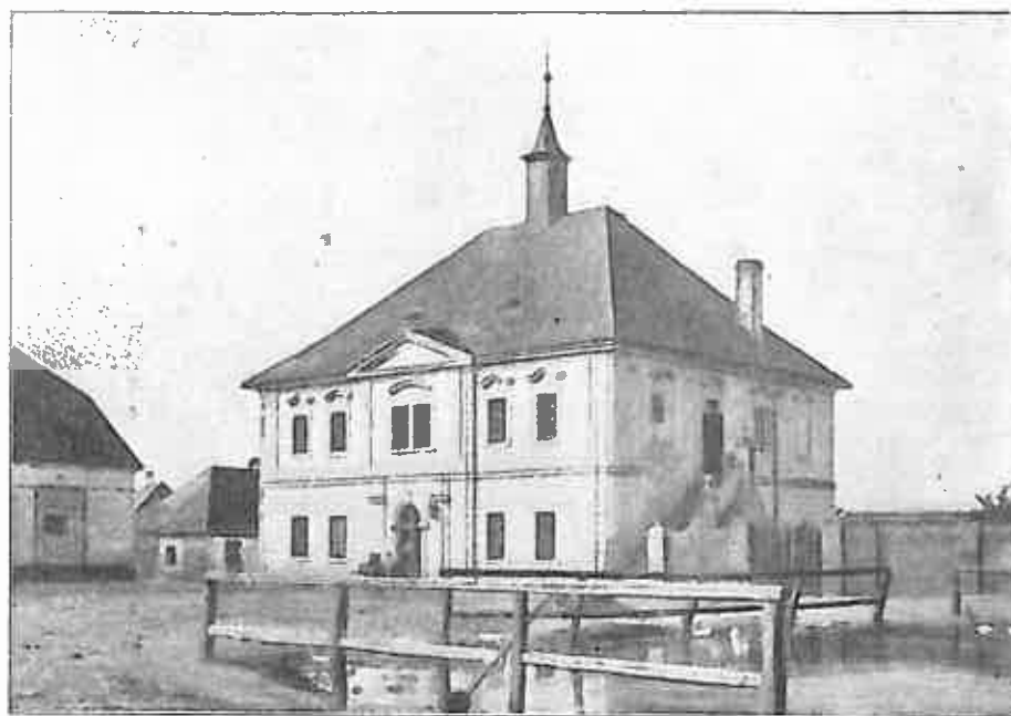
Zámek v Hlízově.

Po úmrtí uč. Havliče obdržel učitel od vdovy . . . . . 35 zl. stř. R. 1855 v únoru vybírala škol. plat obec a platila učiteli . . . . . 183 zl. 38 kr. stř.