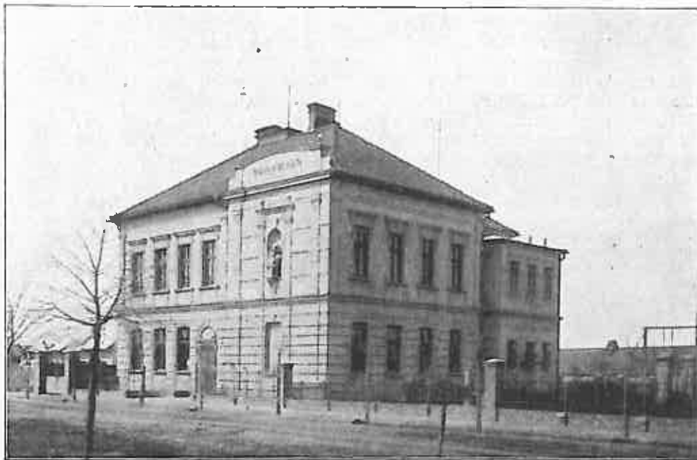
Škola v Hlízově.

Domy hlízovské tvoří podél silnic pravidelné ulice a odděleny jsou narmnoze zahradami anebo jen dvory sousedících hospodářů. Výstavnost jest jednoduchá. Kromě zámku ve dvoře a nové škol. budovy jest jen jedno stavení o poschodí; ostatní budovy jsou vesměs přízemní. Čtyři starší chalupy byly ještě před nedávnem dřevěné s krytem doškovým a na štítech jejich byly vyřezány kalichy. Patrně náležely za dávných časů vyznavačům pod obojí. Dnes ovšem není po nich ani památky. Ostatně jsou domy vystavěny z kamene a cihel pálených a jsou kryty taškami nebo břidlicí, ano i šindelem.